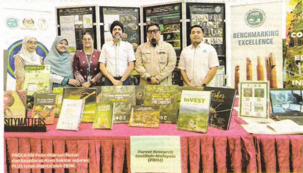
PROGRAM Pemuliharaan Hutan dan Kesedaran Alam Sekitar anjuran PLUS turut disertai oleh FRIM.

"PLUS sentiasa komited terhadap pengurusan alam sekitar yang baik dan menyokong pembangunan kelestarian negara," ujarnya.