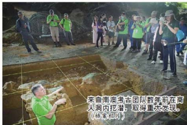
来自南澳考古团队数年前在商人洞内挖潜，取得重大发现。

张庆信还透露，马来西亚正在努力提名更多遗址作为联合国教科文组织世界遗产，其中包括雪兰莪州的马来西亚森林研究所森林公园、柏隆皇家公园和国家麻风病控制中心。