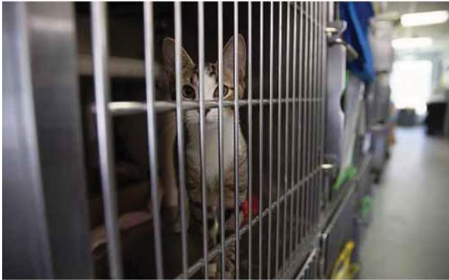
BANYAK pengabaian dilakukan oleh sesetengah pemilik kucing dan anjing sehingga kesihatan dan kebajikan haiwan tidak terjaga.

Kerajaan perlu tegas dalam menangani isu penganiayaan haiwan. Jika pelaku membunuh kucing, mereka perlu dijatuhkan hukuman yang setimpal.