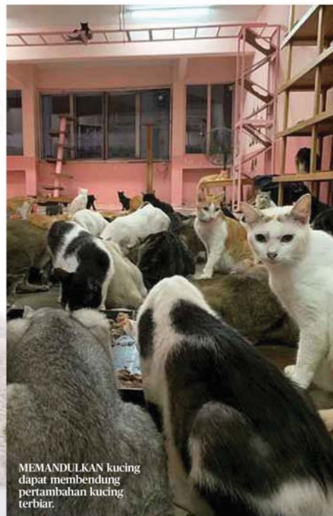
MEMANDULKAN kucing dapat membendung pertambahan kucing terbiar.

“Bila tidak dimandulkan, mereka akan beranak banyak, secara tidak langsung akan memberi kesan kepada kita yang tidak mampu seterusnya kita akan merasakan tekanan dan dari situlah munculnya penganiayaan binatang,” katanya.