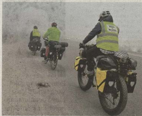
PERSEDIAAN mental dan fizikal amat penting ketika melakukan kayuhan basikal.

Tanpa tajaan mana-mana pihak, kesemua peserta kayuhan Haji 2024 itu menggunakan wang tabungan dan simpanan sendiri bagi