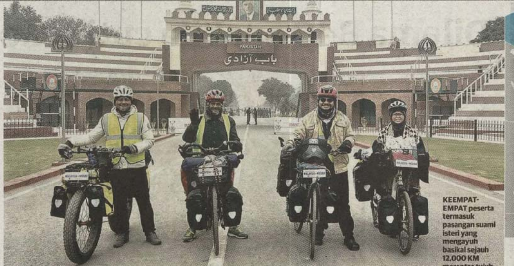
KEEMPAT-EMPAT peserta termasuk pasangan suami isteri yang mengayuh basikal sejauh 12,000 KM merentas tujuh negara.

» Touring bike iaitu gabungan mountain bike + road bike kerana mempunyai tayar yang lebih besar dan mampat.