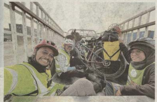
SEMASA diangkut menaiki lori selepas melakukan kayuhan dari Zahir Pir di wilayah Punjab, Pakistan.

"Saya perlu memohon kebenaran daripada ketua jabatan dan pihak pengurusan atasan terutamanya kelulusan dari Kementerian Luar.