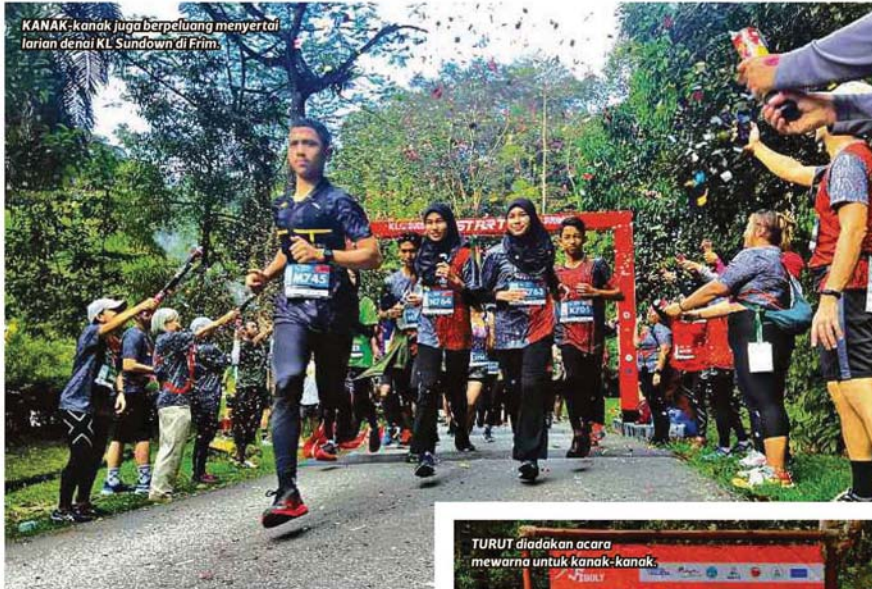
KANAK-kanak juga berpeluang menyertai larian denai KL Sundown di Frim.