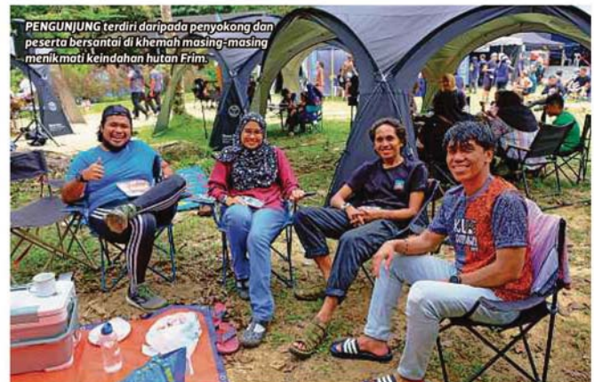
PENGUNJUNG terdiri daripada penyokong dan peserta bersantai di khemah masing-masing menikmati keindahan hutan Frim.