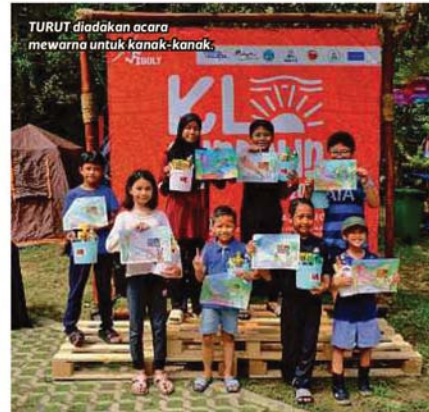
TURUT diadakan acara mewarna untuk kanak-kanak.

Bercerita mengenai KL Sundown, katanya, acara itu menawarkan cabaran ketahanan 'endurance' kepada peserta kerana ada dua format dipertandingkan iaitu enam dan 12 jam yang mana pemenang dikira mengikut jumlah pusingan terbanyak dalam tempoh itu.