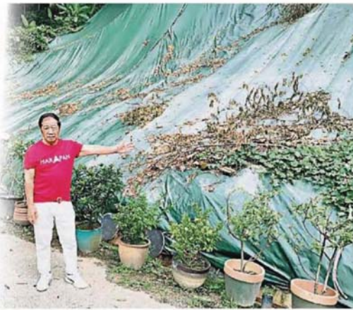
士拉央市议会已在山坡处盖上帆布，防止雨水渗入山坡泥土中。