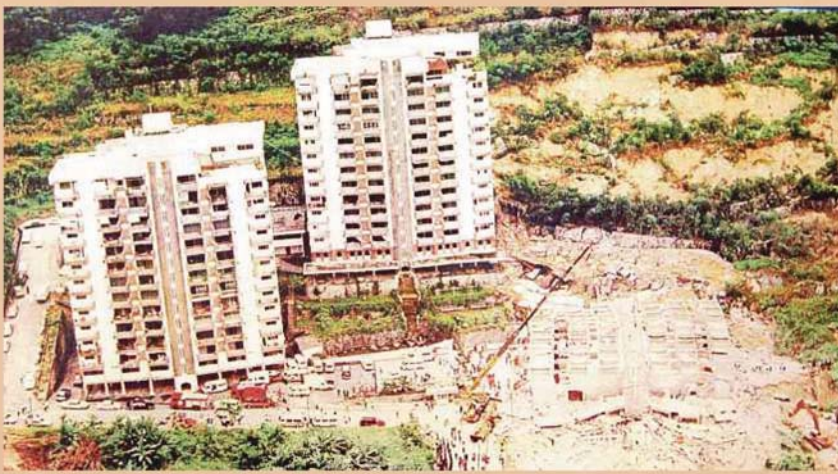
TRAGEDI runtuh Kondominium Highland Tower, Bukit Antarabangsa, Ulu Klang.