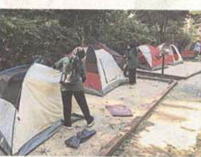
馬來西亞森林研究院的露營區，適合團體、學校和公司團來體驗露營樂趣，院方也提供帳篷、睡袋等露營必備。