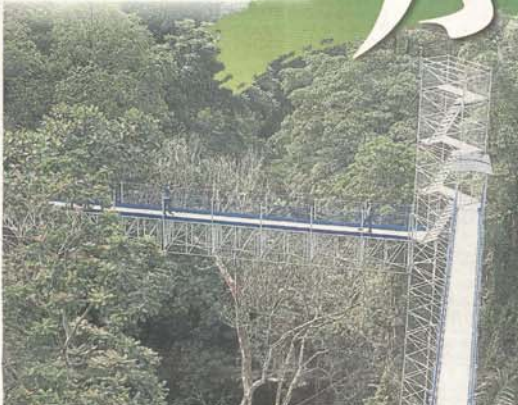
徒步空中森林步道上，海拔至少18至35公尺，並距離高樓「參天大樹」，是種新奇體驗。

該空中森林步道全長250公尺，是全馬首個鋼制結構的空中步道，共有9個高度介乎18至50公尺的樓梯塔。徒步期間會有微微晃感，非常刺激。登上其中最高的塔，不僅能俯瞰整個植物園區，還能遠眺吉隆坡塔和風獅吼塔。為保障訪客安全，每個樓梯塔時間只限最多2人攀登，而欲登上50公尺高塔者，必須另付5令吉，且每個時段還只開放6個名額，只能逗留5至8分鐘。