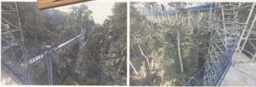
空中森林步道採用鋼制結構，且在建設過程中沒有採用大型機械，避免大挖土木對森林和自然界的破壞。