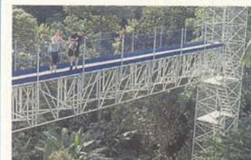
全長250公尺空中森林步道，限訪客需于30分鐘內走完，拍攝打卡就要把握時間呢!