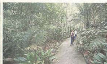
設于甲洞植物園內的拉薩步道，共有400公尺，是適合殘障人士徒步的小徑，曾于2008年獲頒大馬路獎大獎。