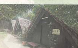
相較于A區，B露營區主要設有8間小茅屋，供訪客直接入住，就建在森林內的民宿。

對大自然植物物感興趣，不想只是走馬看花遊覽的民眾，不妨組團 (10人) 參與「自然導覽」活動，讓導覽員帶領深入林內，來趟知識之旅。上述自然導覽活動，備有數條不同的徒步路線，包括克隆木步道 (Denai Kenung)、沙列步道 (Denai Salih)、風車木步道 (Denai Engkabong)、Sebah步道的拉薩步道 (Denai Razak)，各有不同特色，行程約為兩三小時。