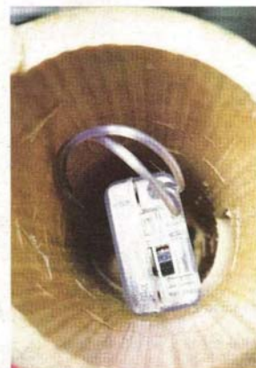
PANJUT LED mudah dikendalikan kerana hanya menggunakan kuasa bateri.