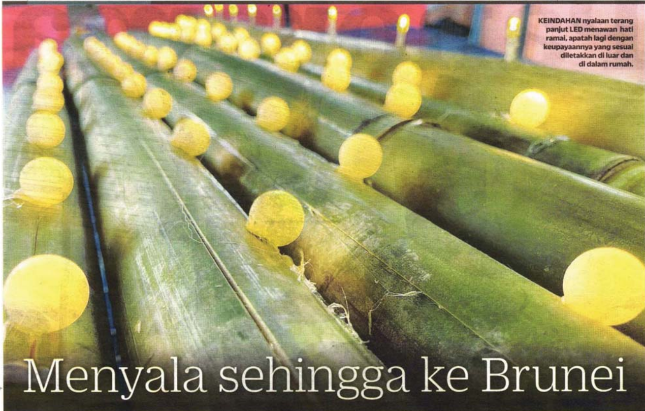
KEINDAHAN nyalaan terang panjut LED menawan hati ramai, apatah lagi dengan keupayaannya yang sesuai diletakkan di luar dan di dalam rumah.