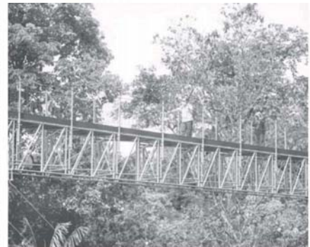
MEMIKMATI PEMANDANGAN: Pada aras ketinggian 141 meter dari aras laut, anda boleh menikmati pemandangan panorama bandar raya Kuala Lumpur secara 360 darjah termasuk Menara Berkembar Petronas, Menara Kuala Lumpur serta Menara Tun Razak Exchange. Orang ramai yang berminat untuk mencuba tarikan itu boleh membuat tempahan awal di laman web FRIM dengan bayaran tiket antara RM8 hingga RM15, yang dibuka pada 8.30 pagi hingga 3.30 petang di Kuala Lumpur.