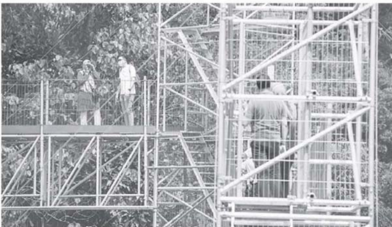
MULAI DIBUKA: Forest Skywalk atau Jejantas Rimba di Taman Botani Kepong seliaan Institut Penyelidikan Perhutanan Malaysia (FRIM) yang telah dibuka semula kepada orang ramai sejak 16 Okt lepas selepas lebih setahun ditutup susulan penularan COVID-19 di Kuala Lumpur, semalam.