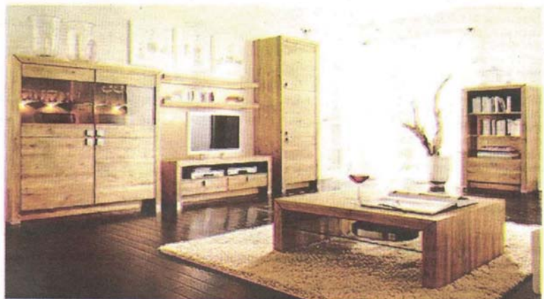
REKA bentuk yang unik, menarik dan berkualiti boleh menalakkan semula imej negara sebagai antara pengeluar perabot terbesar di pasaran antarabangsa.

"Susulan itu, FRIM menawarkan pensijilan hijau