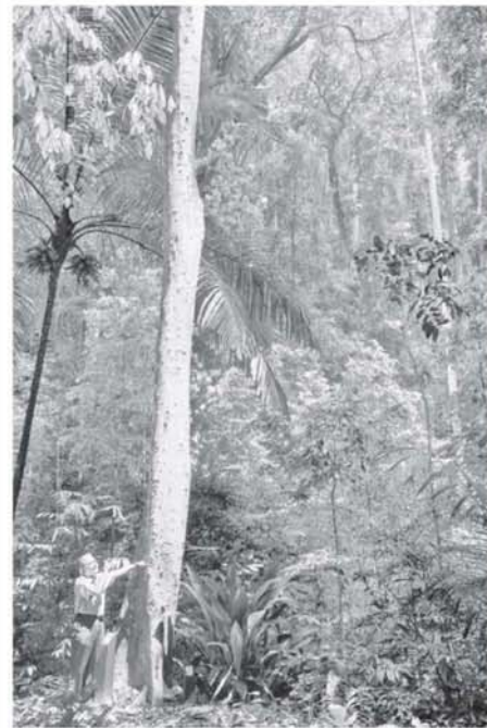
POKOK KEBANGSAAN: Khali menunjukkan Pokok Merbau yang merupakan Pokok Kebangsaan ketika ditemu Bernama baru-baru ini sempena Hari Hutan Antarabangsa 2021.

"Semua jenis lawatan ke FRIM juga sebenarnya memerlukan kebenaran sama ada dalam bertulis ataupun tiket, meskipun hanya untuk rekreasi ataupun berjoging.