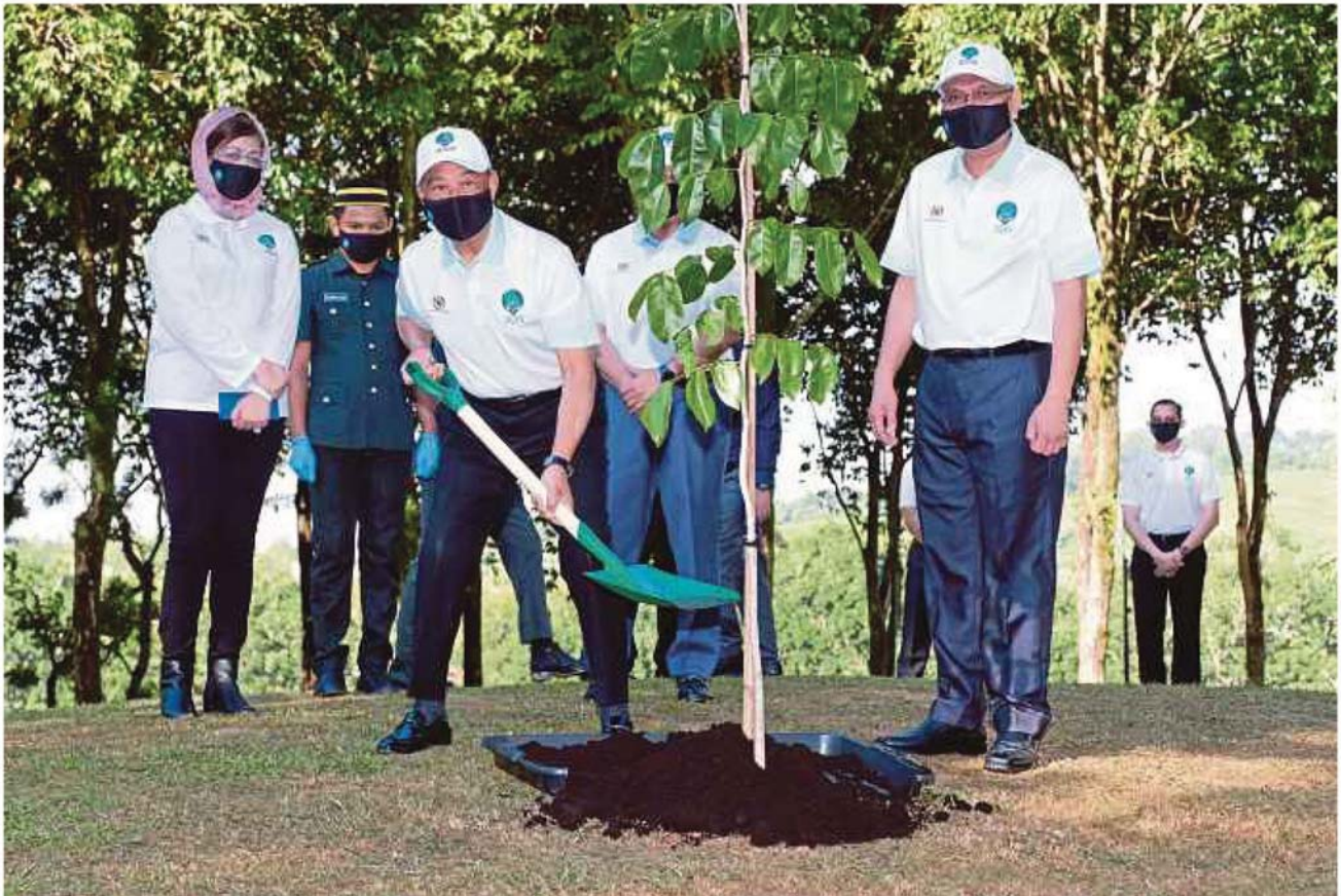
Muhyiddin ketika melancarkan Kempen Penanaman 100 Juta Pokok (2021–2025) dengan menanam Pokok Merbau anjuran Jabatan Perhutanan Semenanjung Malaysia di Kediaman Rasmi Seri Perdana, Putrajaya 5 Januari lalu.