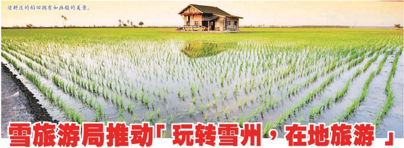
适耕作的稻田拥有如画般的美景。