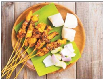
加影沙爹名列大马著名美食之一。

此外，雪州旅游局也在发布会当天与马来西亚入境旅游协会 (MITA) 签署合作协议，推出17个「玩转雪州，在地旅游」旅游配套，并由马来西亚入境旅游协会进行宣传，向国人推介雪州各类旅游配套。