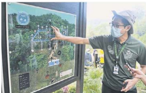
造，包括8天空步道，11塔和最高的了望塔。在售票站前，可先观看森林之塔的设计图。

复暑期活动管制令期间，新的森林天空步道每日限定接待400人，目前有3个探访时段，即是早上8时30分、早上10时30分和下午2时正。每一时段，接待处将提早30分钟，让游客领取登机塔固本。 阿兹雅雅哈雅说，“游客反应热烈，让我们始料不及。接下来，我们会增加富有森林教育的资讯容。未来，我们将推出预订配套，以确保访客能够取得门票，并会有导览员陪同。”