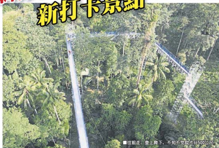
往前走，登上爬下，不知不觉就步行500公尺