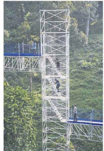
很多人畏高但不知，买票前，真的要看好。

亲自完成一趟森林天空步道，他说：“基本感受不错，只是担心50公尺高的了望塔。我本身怕高，刚上去，脚开始麻麻。” 塔下有人走动，高耸的资料，以免晃动。望塔，难免晃动。