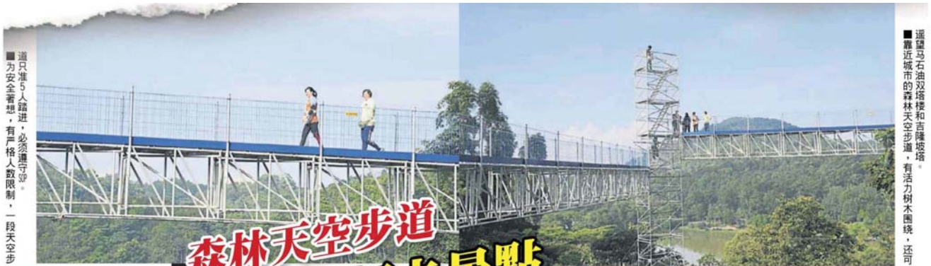
道只准5人踏进，必须遵守守。为安全着想，有严格人数限制，一段天空步