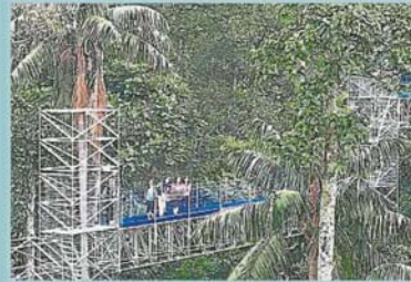
访客在森林高空高举自带的马来西亚国旗，欢庆国庆日!