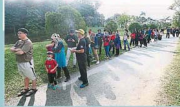
大批已经领取号码牌的民众，在空中森林步道售票柜台外大排长龙准备购票。