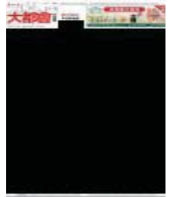
▼吉隆坡的新景点——空中森林步道，让人在空中感受清新空气，欣赏雨林美景。