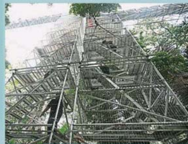
空中森林步道共有9个楼梯塔，高度介于18至50公尺。