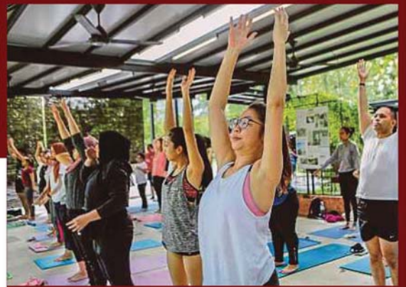
Aktiviti yoga percuma setiap pagi.