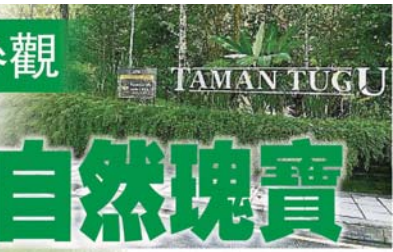
紀念碑公園占地66英畝，其中40英畝已獲打造成森林步道。

1 走累了，不妨坐下脚步，在凉亭休憩，静下来感受大自然的魔力。 2 马来西亚森林研究院人员在纪念碑公园内其中大约800棵树贴上树名标签 3 公园内最大的埔菜树，其树干的直径达170公分。 4 空气清新森林步道吸引跑步者晨跑，接触大自然。 5 公园内还设有“森林屋”，让民众可在宁静的环境下休息。