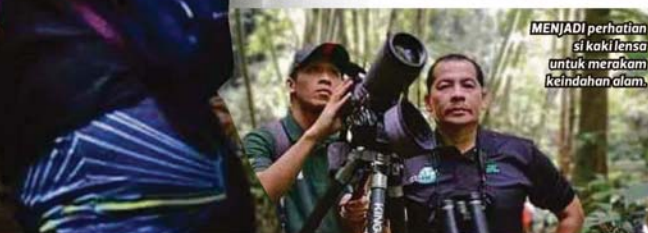
MENJADI perhatian si kaki lensa untuk merakam keindahan alam.