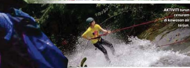
AKTIVITI turun cenuram di kawasan air terjun.