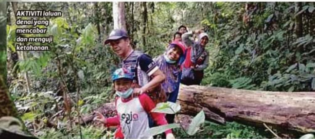
AKTIVITI laluan denai yang mencabar dan menguji ketahanan.

"Dalam perjalanan, pengunjung boleh mengetahui pelbagai spesies pokok hutan kerana lebih 30 batang pokok sudah dilabel FRIM," katanya.