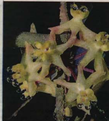
SPESIES hoya yang ditemui pada tahun 2018 di Terengganu.