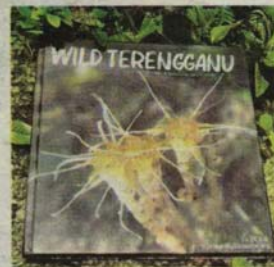
BUKU Wild Terengganu yang diterbitkan Suzairi ini memaparkan koleksi unik flora dan fauna yang terdapat di Terengganu.

Suzairi menjelaskan sepanjang penerokaannya di hutan pergunungan di seluruh Terengganu, sebanyak 10 spesies baharu orkid, peruk kera serta thismia berjaya diuraikan bersama penyelidik tempatan.