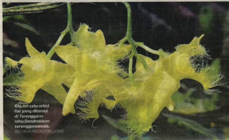
SALAH satu orkid liar yang ditemui di Terengganu iaitu Dendrobium terengganuensis.